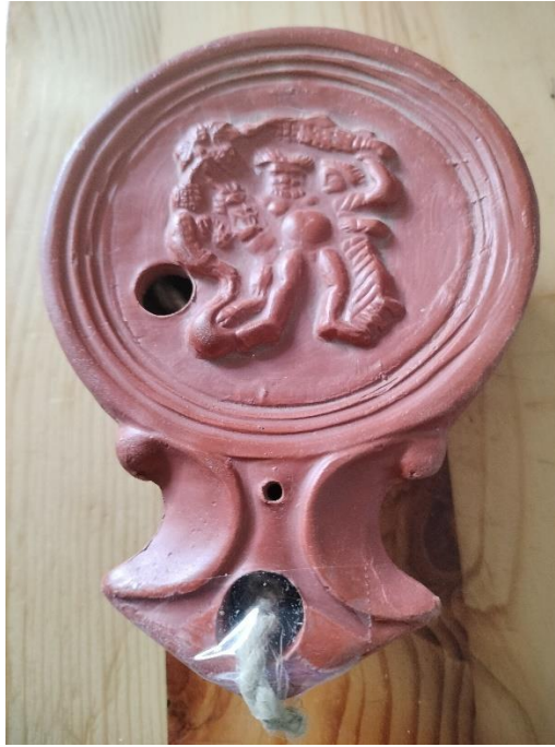
Lampe à huile sigillée gréco-romaine à vernis rouge Argile provenant de La Graufesenque.

La céramique sigillée , anciennement appelée poterie samienne , est une céramique fine destinée au service à table caractéristique de l'Antiquité romaine. Elle se caractérise par un vernis rouge grésé cuit en atmosphère oxydante, plus ou moins clair et par des décors en relief, moulés, imprimés ou rapportés. Certaines pièces portent des estampilles d'où elles tirent leur nom, sigillée venant de « sigillum », le sceau. Ce type de poterie rencontra un très grand succès dans le monde méditerranéen à partir du règne d'Auguste.